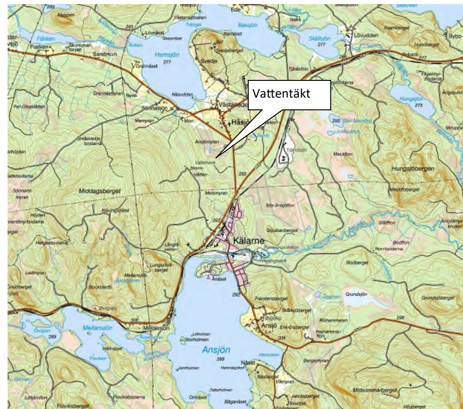
Kartan visar vattentäktens läge

Informations- och samrådsmöte hålls endast vid efterfrågan, vill du träffa oss så ring så bestämmer vi tid och plats.