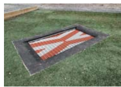
Trampolin i marknivå