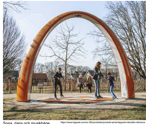
Sona, dans och musikbåge